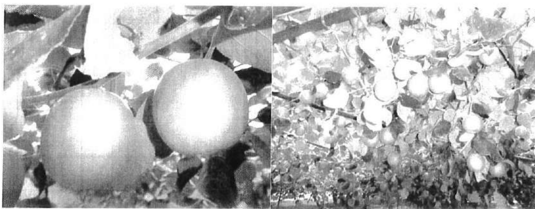
台農 13 號-雪麗果型扁圓，果皮光亮蠟質